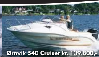
Ørnvik 540 Cruiser kr. 1.39.800,-