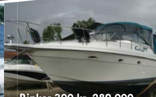
Rinker 300 kr. 289.000,-