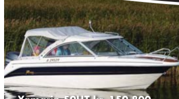
Yamarin 59HT kr. 159.800,-